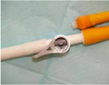
Figuur 8: Kraantje open

Heeft de arts aan het uiteinde van de sonde een kraantje laten bevestigen, dan moet u zelf op gezette tijdstippen uw blaas leegmaken. Uw blaas zal zich gewoon vullen. In plaats van te plassen, opent u het kraantje om de blaas te laten leeglopen (figuur 8 en figuur 9).