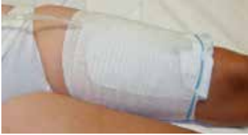
Figuur 11: Beenzakhouder

U kunt de beenzak met een beenzakhouder dragen in plaats van met beenriempjes (figuur 11). Zo'n houder kost ongeveer 15 euro (voor 2 stuks).