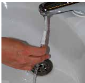
Figuur 7: De nachtzak doorspoelen met water

Nadat u de nachtzak met de beenzak verbonden hebt, opent u het kraantje van de beenzak zodat de urine van de beenzak in de nachtzak kan doorlopen (figuur 6).