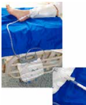
Figuur 6: Doorkoppelen beenzak naar nachtzak