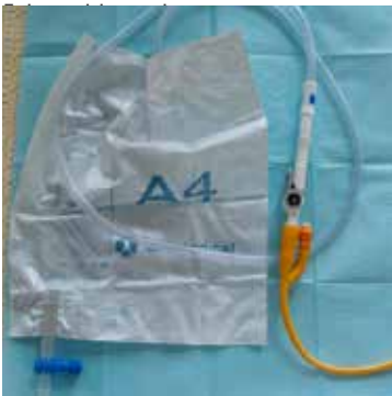
Figuur 10: Nachtzak aan kraantje

Voelt u plasdrang, ga dan naar het toilet om uw blaas te laten leeglopen door het kraantje te openen. Voelt u geen plasdrang meer, open dan elke vier tot zes uur het kraantje om uw blaas te ledigen. 's Nachts mag u een nachtzak aan het kraantje koppelen. Zo hoeft u niet op te staan om uw blaas te ledigen (figuur 10).