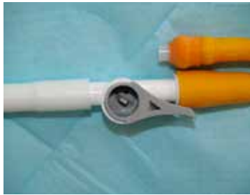
Figuur 9: Kraantje gesloten

Voelt u plasdrang, ga dan naar het toilet om uw blaas te laten leeglopen door het kraantje te openen. Voelt u geen plasdrang meer, open dan elke vier tot zes uur het kraantje om uw blaas te ledigen. 's Nachts mag u een nachtzak aan het kraantje koppelen. Zo hoeft u niet op te staan om uw blaas te ledigen (figuur 10).