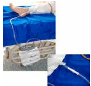
Figuur 6: De beenzak doorkoppelen naar de nachtzak

U mag de beenzak losmaken van uw been en naast u in bed leggen. De nachtzak legt u het best op de grond naast uw bed. Let wel op dat het kraantje van de nachtzak gesloten is. Tip: leg de nachtzak in een waskom naast uw bed. Als u het kraantje zou vergeten dichtzetten, loopt de urine niet op de vloer.