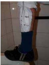
Figuur 4: Kraantje weggestoken in de kous

U kunt de beenzak op uw bovenbeen of onderbeen dragen. De lengte van de leiding en de beenriempjes zijn aanpasbaar. U kunt dus een rok of korte broek dragen als u de beenzak op het bovenbeen draagt. Draagt u de beenzak op het onderbeen, steek dan het kraantje in uw kous zodat het niet zichtbaar is wanneer u gaat zitten (figuur 4).