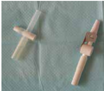
Figuur 2: Kraantjes