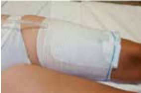
Figuur 11: Beenzakhouder

U kunt de beenzak met een beenzakhouder dragen in plaats van met beenriempjes (figuur 13). Zo'n houder kost ongeveer 15 euro (voor 2 stuks).