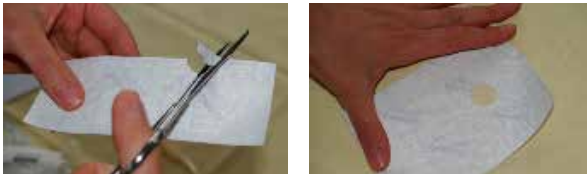
Figuur 11: Een gevensterd verband knippen

De sonde kleeft u vast met een gevensterd verband uit niet-geweven verbandstof. Merknamen van dit type verbandstof zijn Hypafix® of Fixomul®. U knipt een strook verbandstof van 8-10 cm op 15 cm. Op ongeveer 4 cm van het uiteinde knipt u een venster van 2 cm doorsnede (figuur 11).