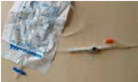
Figuur 10: Nachtzak aan kraantje

Voelt u geen plasdrang meer, open dan elke vier tot zes uur het kraantje om uw blaas te ledigen. 's Nachts mag u een nachtzak aan het kraantje koppelen. Zo hoeft u niet op te staan om uw blaas te ledigen (figuur 10).