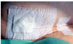
Figuur 12: Verband suprapubische sonde

De insteekplaats van de sonde komt ter hoogte van het venstertje. De lange zijde van het verband kleeft u over het verloop van de sonde. Over de insteekplaats van de sonde kleeft u een gaasverbandje (figuur 12).