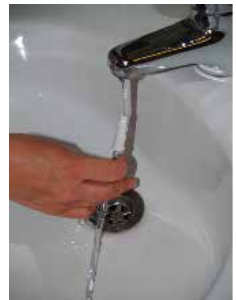
Figuur 7: De nachtzak doorspoelen met water

U kunt eenmaal per week de nachtzak met water en azijn doorspoelen om de urinegeur te verminderen (200 ml water en 100 ml azijn).