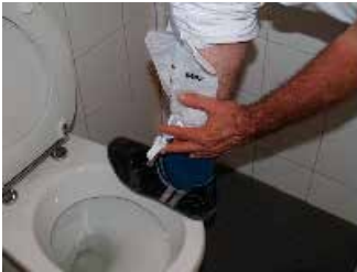
Figuur 3: De urinezak leegmaken in het toilet

U moet de beenzak om de vier tot zes uur legen of wanneer de zak voor tweederde gevuld is. Dat doet u door een voet op de rand van het toilet te zetten. U richt de kraan op de toiletpot en opent ze (figuur 3).