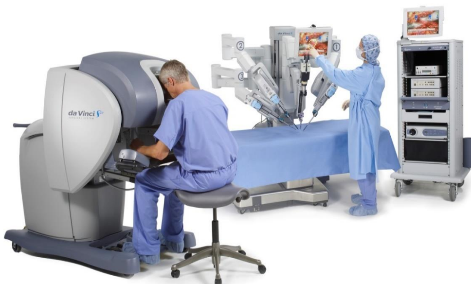
Figuur 3: Operatierobot

De ingreep zelf wordt uitgevoerd met behulp van een operatierobot. Deze robot bestaat uit 2 delen. Het eerste deel is een console waarachter de chirurg plaatsneemt. Van hieruit stuurt hij de robot aan. Aan de operatietafel zelf staan een instrumentist en eventueel een assistent die de robotarmen plaatsent. De armen van de robot worden bediend van achter de console.