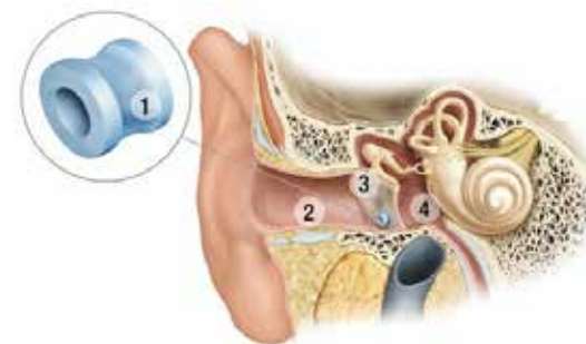
1. Diabolo / 2. Uitwendige gehoorgang / 3. Trommelvlies / 4. Middenoor