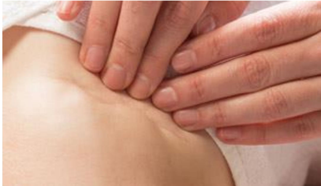
Behandel oedeem/lymfoedeem met fasciatechniek - Uw Huidtherapeut ( dermaflow.nl )