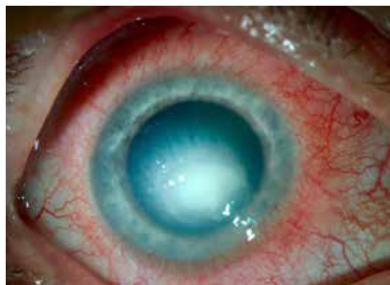
Stechtzend oog voor de transplantatie

Graag geven wij je hierover meer informatie. Vraag je arts of verpleegkundige ernaar.