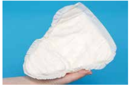
Opvangverband voor mannen

Bij licht urineverlies kunt u ook wasbaar incontinentiemateriaal gebruiken, zoals bijvoorbeeld UnderWunder of Entusia. Dat ziet eruit als een normale slip maar dan met een absorberend kruis.