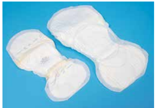
Opvangverband voor 's nachts

Daarnaast is het raadzaam om het opvangverband goed ter plaatse te houden met een aansluitende onderbroek.